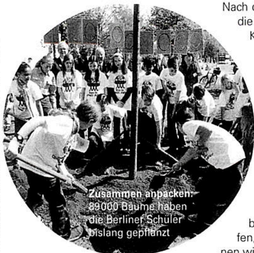
Zusammen anpacken: 89000 Bäume haben die Berliner Schüler bislang gepflanzt

Nach diesem Prinzip hat sie die Schule strukturiert. Konsequentermaßen lernen die Schülerinnen und Schüler vom ersten Tag an, dass es hier keine Pflöcke gibt, die sie daran hindern könnten, sich auf Entdeckungsreisen zu den Lehrinhalten zu begeben. Nach und nach begreifen sie, dass sie hier selber entscheiden dürfen, welche Themen ihnen wichtig sind oder zu welchem Zeitpunkt sie das von ihnen